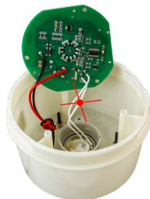
Рис. 3 – Внутренняя часть лампы

Для использования лампы без звуковой сигнализации (сирены), нужно перерезать или отпаять белый провод (рис. 3), соединяющий плату управления со звуковым модулем