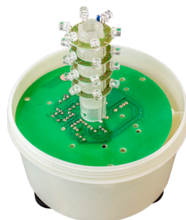
Рис. 1 – Платы управления со светодиодами